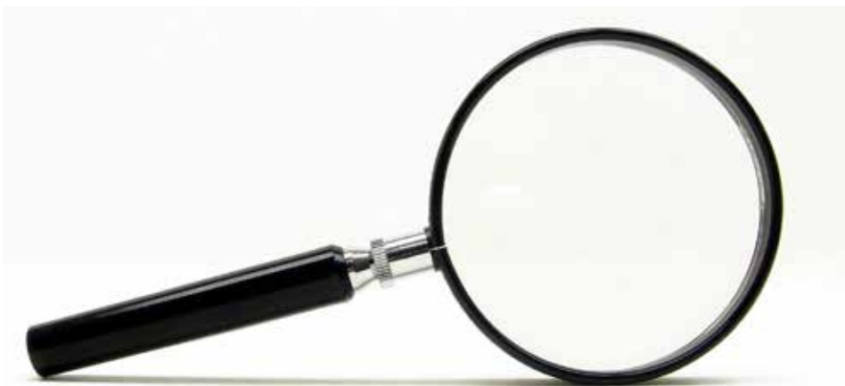
De preek onder een vergrootglas

In onze kerkorde worden onder B23 de taken van de ouderling beschreven. Wat hun taak is met betrekking tot de preekbespreking wordt hier niet genoemd. De KO richt zich met name op de herderlijke zorg aan de gemeente en het waken over het geestelijk leven van de gemeenteleden. Het bevesti-