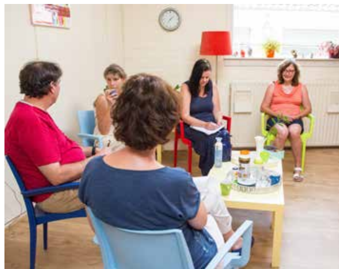
Gespreksgroep voor studenten

In Exodus 5: 22 geeft Mozes God er de schuld