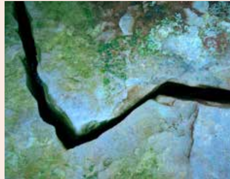
Een kerkscheuring volgde

Wat opvalt aan de reactie van de kerkenraad van nu is de openheid waarmee ze communiceren. Er is een door het Meldpunt Seksueel Misbruik team benoemd van een jurist, een theoloog en een gedragswetenschapper die de gang van zaken van toen moet onderzoeken. 'Recherchewerk', zegt de woordvoerder van de kerkenraad, die voor zijn pensionering woordvoerder van de politie was. De dader moet schoon schip maken. Daar zijn de slachtoffers mee gebaat. Zij dragen de last van het misbruik en van het stilzwijgen met zich mee.