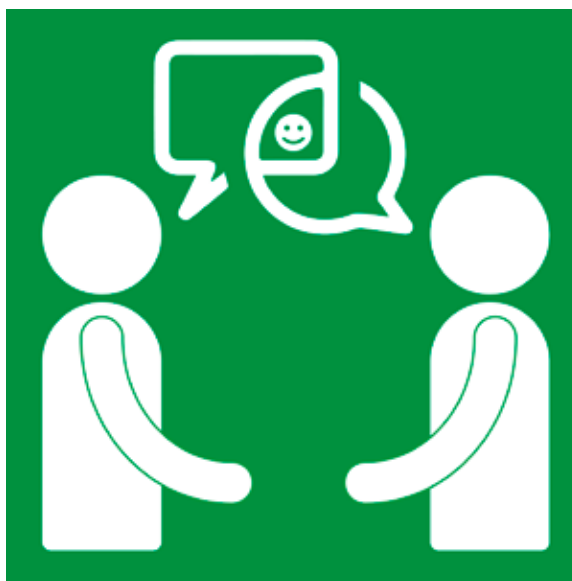
Samen bespreken waar je meer over wilt horen

Eventueel zou je deze vragen ook digitaal aan een aantal gemeenteleden kunnen voorleggen.