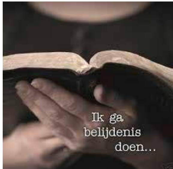
Ga ik belijdenis doen?

Wat ook van belang is om 'student zijn' en 'kerk en geloof' met elkaar te verbinden is, wat officieel uitgedrukt, het pastoraat van de presentie. Dat wil zeggen dat ik op allerlei plekken en momenten waarop studenten aanwezig zijn ook zoveel als ik kan aanwezig wil zijn. Dat kan zijn